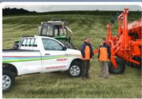
Servicio al Cliente & repuestos